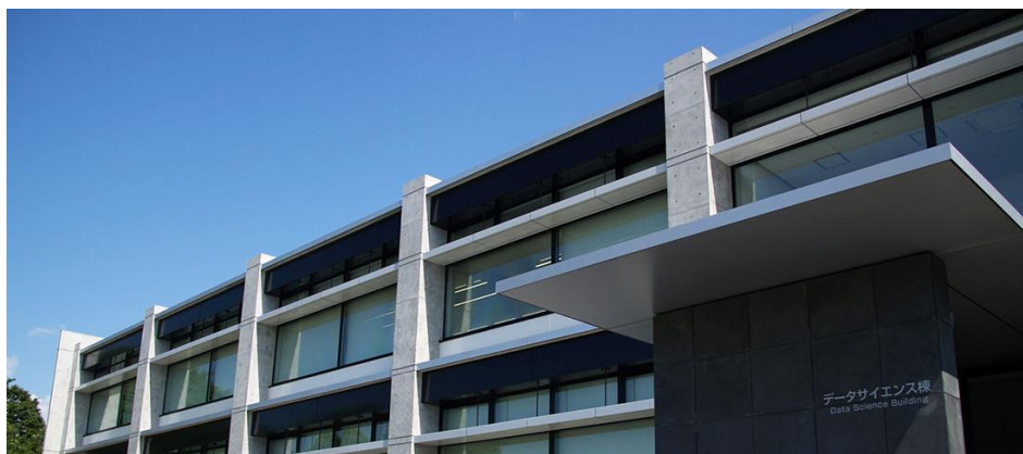
情報・システム研究機構